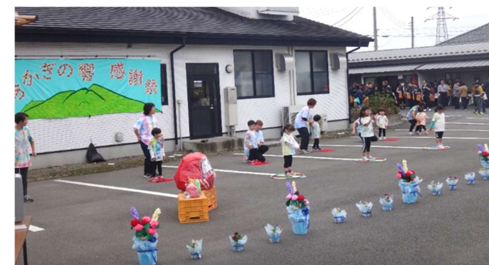
〈初出場のつくしキッズ〉