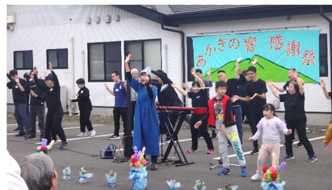
〈フィナーレ『笑顔ひびかせよう』〉

5年ぶりの開催でしたが、大勢の方々に来場していただき活気にあふれる素敵な感謝祭にすることが出来ました。