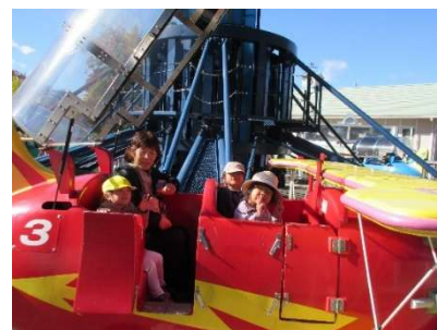
〈遊具に乗り、大はしゃぎ〉

子どもたちのパワーは無限です。「出来ないことはない、挑戦あるのみ」と実感できる社会体験となりました。