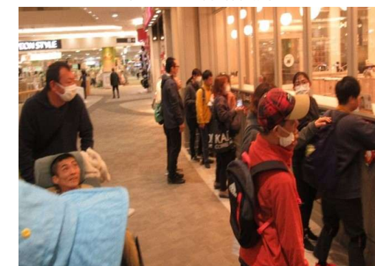
〈スマイル 外出体験〉